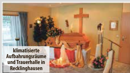
klimatisierte Aufbahrungsräume und Trauerhalle in Recklinghausen