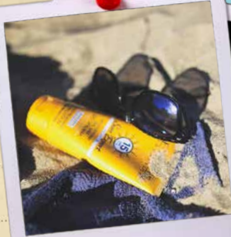
Lara Frühling (28)

Meine Sonnenbrille riecht nach Sonnencreme und hat Macken, die mich an diese schönen Sommerstunden erinnern. Im Winter fällt sie mir zwischendurch Zuhause in die Hände, wenn ich etwas suche und dann beschert sie mir jedes Mal ein Lächeln, weil ich mit ihr so sehr die Sonne auf der Haut, lachen, und Freiheit verbinde. Das lässt mich im Winter noch mehr Vorfreude auf den nächsten Sommer verspüren.