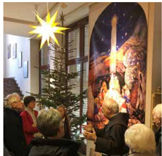
Führung durch Pater Reinhard's Krippenausstellung in Werl 2020

Wenn der Franziskaner sprach, wurde es in den gut gefüllten Kirchen, Sporthallen oder Schulaulen ruhig. Unterstützt von beeindruckenden Dias gab er den bedrückenden Lebenssituationen ein Gesicht: Säuglingssterblichkeit, Kinderarbeit, Analphabetismus, Arbeits- und Obdachlosigkeit waren nicht mehr abstrakt, sondern hatten menschliche Namen. Die Zuhörerschaft begegnete Menschen, die er mit seinem phänomenalen Gedächtnis und mit Empathie vorstellte.